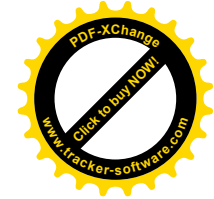
Tabelle 2: Hauptrunde - Gruppe B